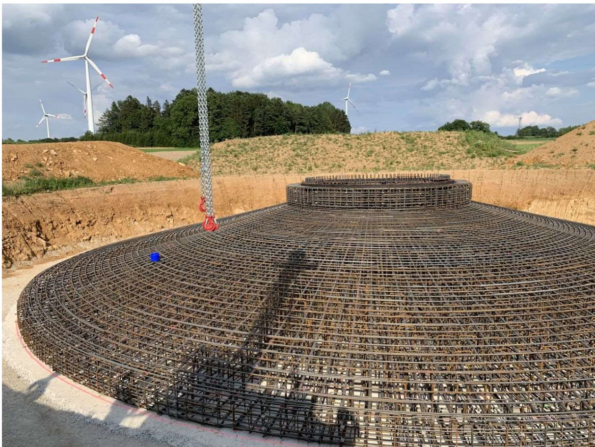
Fundament für eine Windenergieanlage Vestas V 136 der Bürgerwindenergie Altdorf Eismannsberg

Faktisch ist die Handelbarkeit der Kommanditanteile dadurch eingeschränkt, dass kein organisierter Zweitmarkt für Beteiligungen an Windenergieprojekten, wie z.B. bei Aktien, besteht. Der Anleger kann also nicht sicher sein, dass er jederzeit einen Käufer findet oder einen angemessenen Verkaufspreis erzielt. Der Preis berechnet sich im Fall des Verkaufs nicht nach der Höhe des ursprünglichen Erwerbspreises, sondern entwickelt sich in Form eines Verkehrswertes der Anteile in Abhängigkeit vom Erfolg der Gesellschaft sowie unter Berücksichtigung von Angebot und Nachfrage.